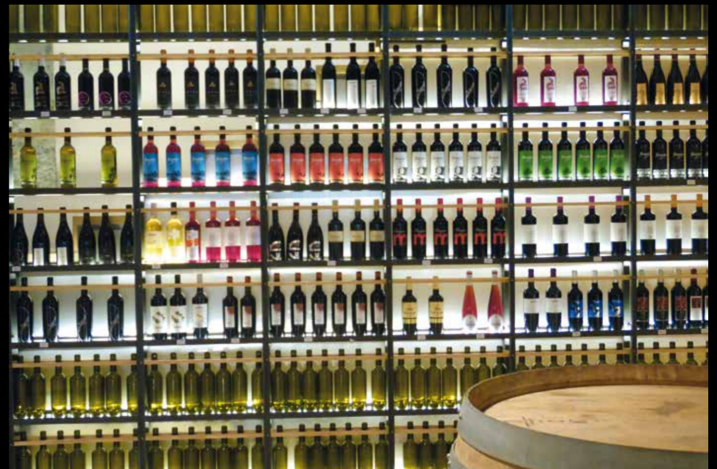
AD02: La Escuela del Vino in Cehegín in een authentieke bodega van het Palacio de la Tercia. Een bezoekje waard!