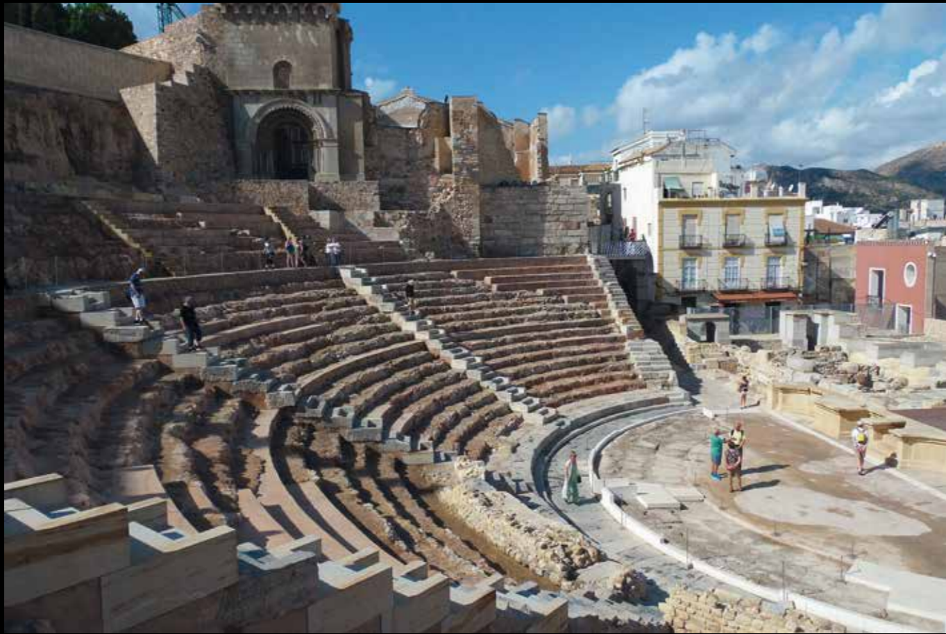
AD03: Romeinse opgravingen in Cartagena. Een heerlijk stadje om doorheen te dwalen!