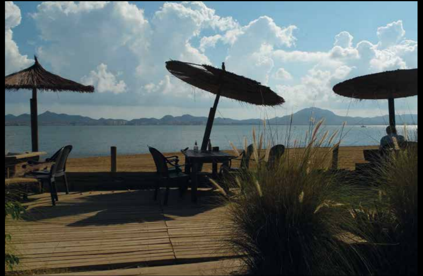
AD05: Veel Spanjaarden hebben in La Manga aan de Mar de Menor hun vakantiehuisje. Het hele jaar door een fijne plek en een unieke plaats voor liefhebbers van natuur en watersporten.