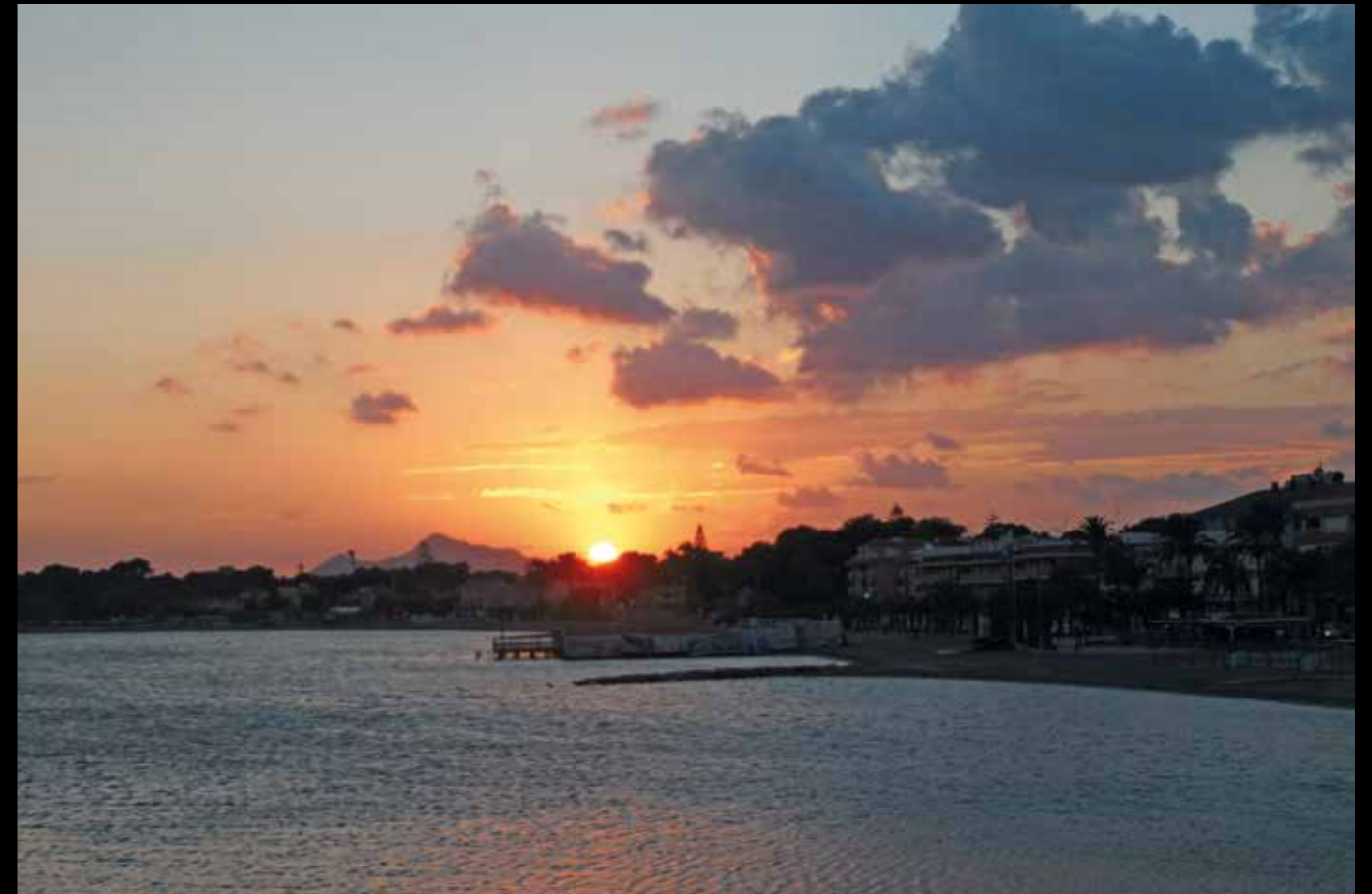
AD01: Een prachtige zonsondergang over de Mar Menor vanaf San Pedro del Pinatar.