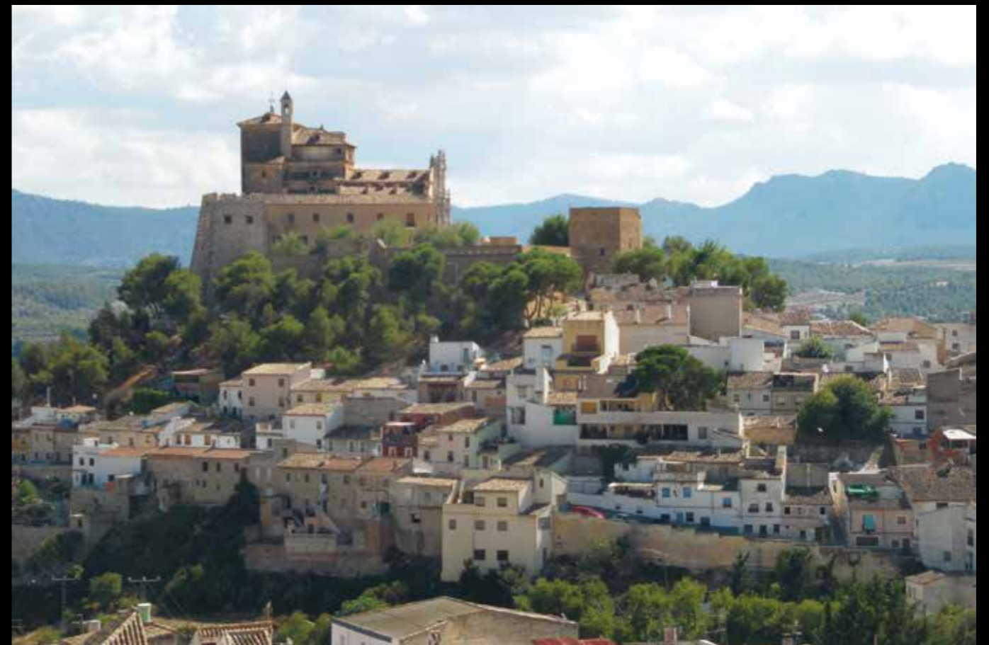
AD06: De klim naar de Basilica de la Vera Cruz wordt beloond met een prachtig uitzicht over het stadje Caravaca de la Cruz.