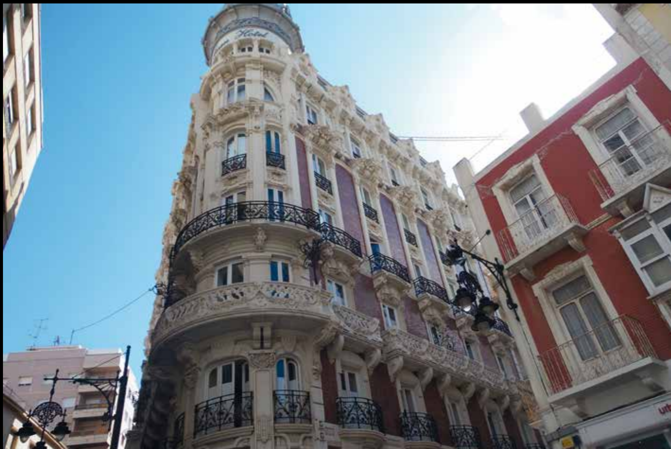
AD04: Cartagena, een verrassende culturele stad met een grote haven, een levendige binnenstad met mooie art deco gebouwen en historische monumenten.